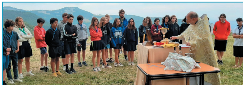
Une proscémie catéchétique en plein air.

À côté des activités de plein air dans le cadre magnifique du Vercors, la vie quotidienne du camp est rythmée aussi par la vie liturgique, avec chaque matin un petit office pendant lequel est lu et commenté l'Évangile du jour, la bénédiction