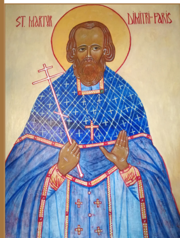
icône peinte par père Wladimir Yagello

Q UAND NOUS AVONS CHERCHÉ UN PROTECTEUR POUR NOTRE PAROISSE, nous avons tout à construire. Nous avons pensé que saint Dimitri, un saint contemporain, compagnon de Mère Marie, serait par ses actes et sa grande foi un exemple pour chacun de nous et sans hésitation nous lui avons confié notre communauté.